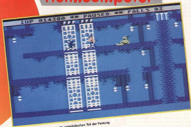
„Bruce Lee“ und seine Gegner im unterirdischen Teil der Festung

unser Held einsammeln muß. Einige dieser Objekte haben darüber hinaus eine zusätzliche Funktion. Werden sie entfernt, so öffnen sich bestimmte Türen des Gebäudes. Diese müssen aber nicht zwangsläufig in dem Raum liegen, den der Spieler sieht. Sammelt man die richtigen Objekte ein, geben sie den Weg zum Thronsaal des Zauberers frei. Da die Festung außerdem noch mit rückischen Fallen gespickt ist, zum Beispiel mit plötzlich aus dem Boden hervorschießenden Heißwasserfontänen, empfiehlt es sich, nicht alle Laternen einzusammeln, sondern