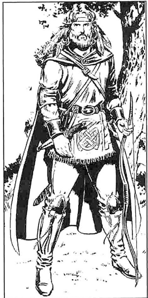
Von Larry Elmore aus "Dragons of Mystery"

Lederschild +2; Langschwert +2 (Zerstörungskraft 1-8); Bogen und Köcher mit 20 Pfeilen (Zerstörungskraft 1-6).