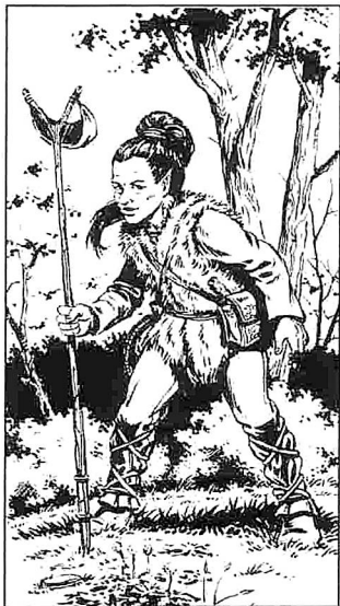
Von Larry Elmore aus "Dragons of Mystery"

Lederschutz; Stabschleuder +2 (Zerstörungskraft 3-8); Schleuder +1 und ein Beutel mit 20 Schuß (Zerstörungskraft 2-7).