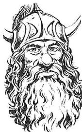
Von Larry Elmore aus "Dragons of Hope"

Flint wurde als Bergzweig geboren und wuchs als solcher auf. Er verließ sein Zuhause, sobald er in der Lage war, seinen Lebensunterhalt selbst zu verdienen. Mit den Jahren verbesserte sich seine Fertigkeit und ein besseres Einkommen ermöglichte es ihm, sich ein kleines Haus in Solace zu kaufen. Das wurde dann seine Basis.