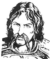
Von Larry Elmore aus "Dragons of Hope"

Der Sohn eines der wahren Ritter von Solamnia, wurde mit seiner Mutter zu Sicherheit nach Süden geschickt, als sein Vater für die Sicherheit der Familie nicht mehr garantieren konnte. Sein Vater sollte eigentlich nach ihnen schicken, sobald die Gefahr sich gelegt hatte - aber er tat es nie. Die Bevölkerung von Krynn verachtete die Ritter und sie wurden beschuldigt - ungerechtfertigterweise - sie hätten beim Aufhalten der Zerstörung versagt.