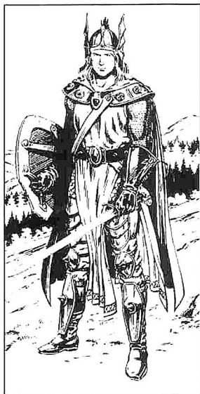
Von Larry Elmore aus "Dragons of Mystery"

Harnisch aus Kettengliedern, Langschwert (Zerstörungskraft 1-8); Speer (Zerstörungskraft 1-6).