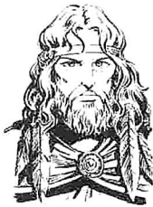
aus "Dragons of Hope"

Nach dem Tod seiner Elfen-Mutter, wuchs der Waise Tanthalas, besser bekannt als Tanis, unter Elfen auf. Aber als halbmenschliches Wesen fühlte er sich immer ein wenig als Außenseiter. Seine ruhelose Natur zog ihn schließlich aus Qualinesti fort, und er ging nach Solace zum einzigen ihm bekannten 'Außenseiter', seinem Freund Flint. Zum Zeitpunkt als er sich mit den Gefährten einließ, war er bereits ein erfahrener Kämpfer, halb Mensch, halb Elf, der die Welt der Krynn auf der Suche nach der Wahren Heilkraft und den Priestern durchstreifte.