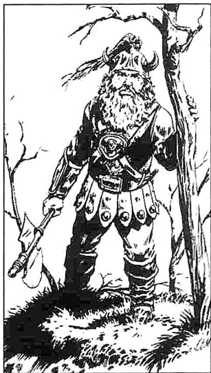
Von Larry Elmore aus "Dragons of Mystery"

Beschlagene Lederschutzkleidung und Schild; Schlachttaxt +1 (Zerstörungskraft 1-8); Wurfäxte (Zerstörungskraft 1-6).