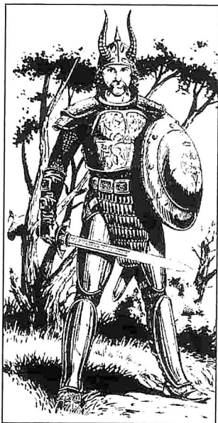
Von Larry Elmore aus "Dragons of Mystery"

Kettenhemdrüstung; Zweihändiges Schwert +3 (Zerstörungskraft 1-10); keine Waffe für Kampf auf Entfernung