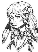
Von Larry Elmore aus "Dragons of Hope"

Als Tochter des Häuptlings des Que-Shu Stammes, war ihr Leben von Geburt an vorbestimmt. Wer immer sie heiraten sollte, würde Häuptling des Stammes werden. Aber niemand wußte, daß die Götter andere Pläne hatten. Das erste Anzeichen dafür, daß nichts davon eintreffen sollte, kam, als sie sich in Riverwind verliebte und nicht in den besten Krieger der standesgemäßen jungen Männer.