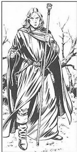
By Larry Elmore, from "Dragons of Mystery"

Staff of the Magus (+3 protection; +2 to hit - damage 1-8); Close combat with Staff as weapon; Ranged combat - see spell list.