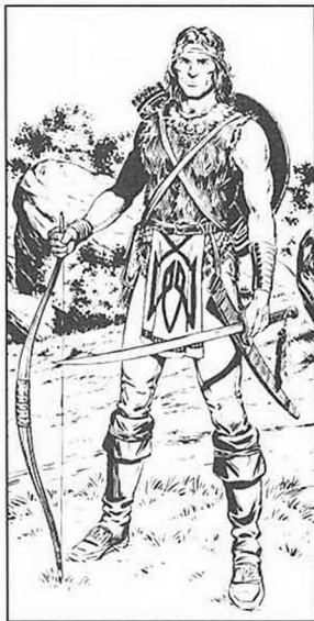
By Larry Elmore, from "Dragons of Mystery"

Leather armor & Shield; Longsword +2 (damage 1-8); Bow & quiver of 20 arrows (damage 1-6).