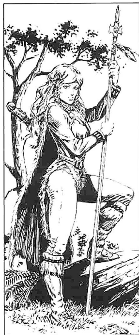
Von Larry Elmore aus "Dragons of Mystery"

Lederschutz, Viertelstab +2; Medallion des Glaubens; Priesterzauber siehe Untermenü.