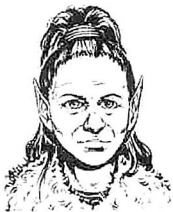
Von Larry Elmore aus "Dragons of Hope"

Die meisten Menschen haben für die Kender kein Verständnis und wollen darüber hinaus auch nichts von ihnen wissen. Ein Teil dieses Umstandes hat seine Ursachen in den grundlegenden Wesenzügen der Kender: ihre Furchtlosigkeit, ihre unglaubliche Neugier, ihre unwiderstehliche Mobilität, Unabhängigkeit und ihr Bedürfnis, alles mitzunehmen, was nicht niet- und nagelfest ist (es sei denn sie haben einen Schraubenzieher - dann allerdings ...).