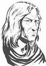
By Larry Elmore, from "Dragons of Hope"

So weak when he was born that he wasn't expected to live, Raistlin survived through his sister's efforts and the protection of his twin brother Caramon. Just before their fifth birthday, the twins were taken to a fair where a conjurer performed tricks and illusions. Caramon watched for a while and wandered off, but Raistlin stayed all day and then astonished his family by reproducing every trick he'd seen.