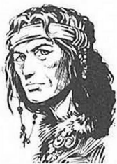
By Larry Elmore, from "Dragons of Hope"

Born into a family of virtual tribal outcasts, no-one in the Que-Shu tribe had a lower social position. His family refused to believe in the divinity of the tribal chieftain and were the last believers in the old gods. Tolerated for his skills, Riverwind would probably have been left alone to live his life had he not asked permission of the tribal chief to marry Goldmoon.