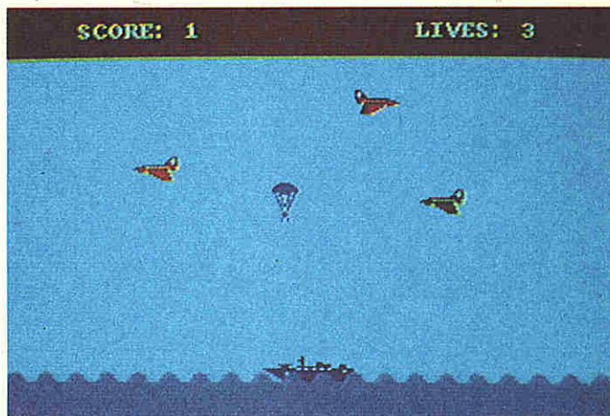
[3] Beispielprogramm »Gamebasic-Game«: Retten Sie die Fallschirmspringer!

ist ein erweiterter PRINT-Befehl zur Textausgabe an gewünschter Stelle auf dem Bildschirm. Möchten Sie z.B. das Wort »Text« mit weißen Buchstaben in der 18.