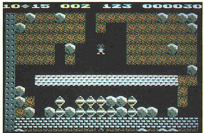
[5] Der kleine Rockford auf Diamantsuche: »Boulder Dash« ist einer der vielen Spiele-Klassiker des C 64!

Studieren Sie aufmerksam die Listings der Demoprogramme und experimentieren Sie mit »Gamebasic-Game« (denkbar wäre statt